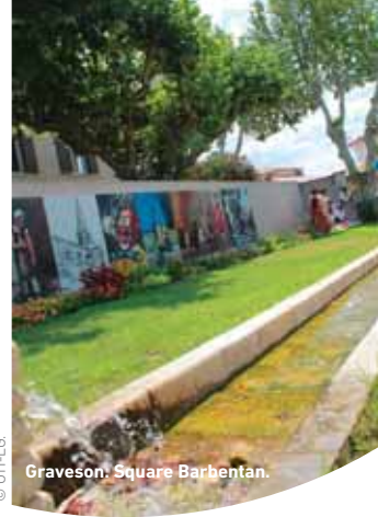
Graveson: Square Barbentane.