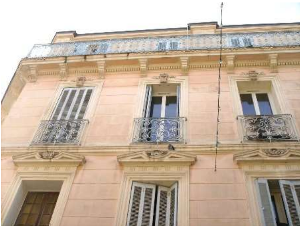
21) Maisons cossues (19 ème s.) - Rue Alphonse Lamartine