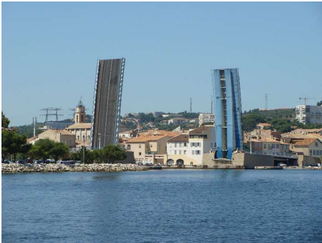
16) Pont levant (1962)