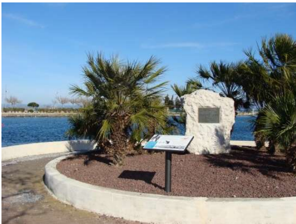
18) Stèle Henri Fabre - Parking Henri Fabre