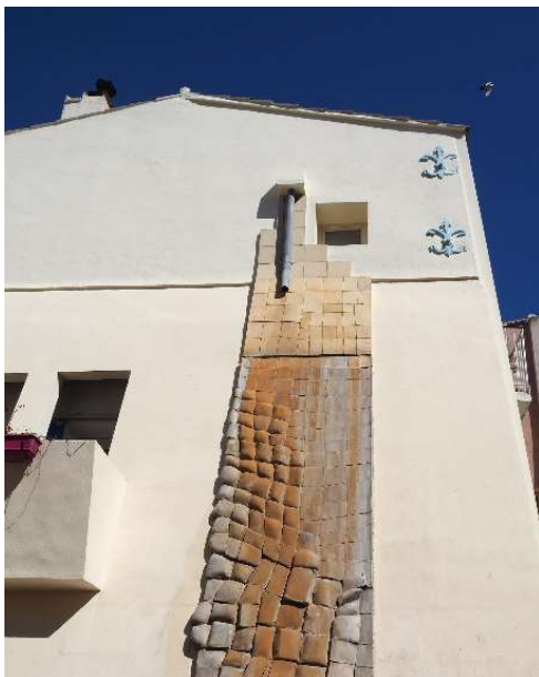
10) Mur fontaine de Bernard Dejonghe - Rue des Cordonniers