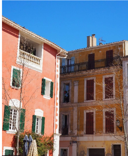
17) Place Mirabeau