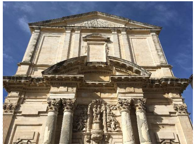
9) Église de la Madeleine (1670) - Place Rouget de L'Isle.