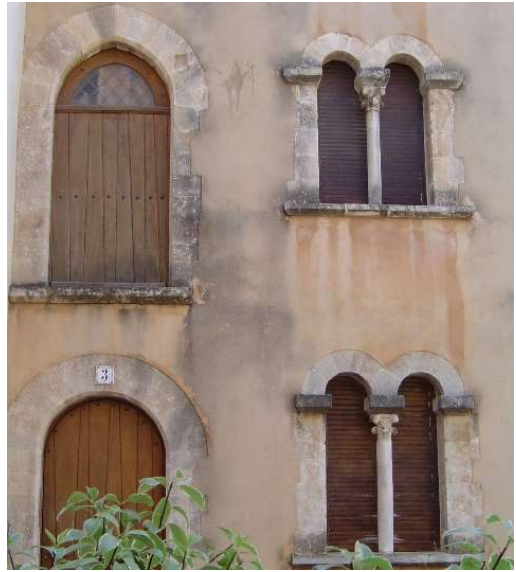
15) Palais comtal (12 ème – 13 ème s.) – Rue Galinière