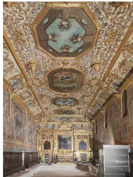
20) Chapelle de l'Annonciade des Pénitents blancs (17 ème s.) - Rue du Docteur Sérieux