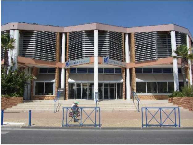
5) Médiathèque municipale Louis Aragon (1981 et 2006) - Quai des Anglais