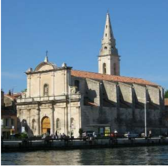
19) Église Saint Geniès (1625) - Rue Alphonse Lamartine