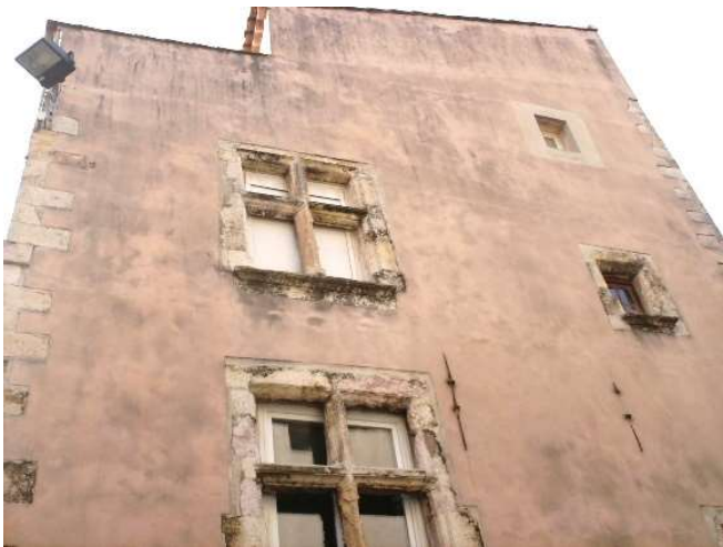
8) Façade avec croisées à meneaux - Quai François Marceau.