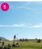
OBÉLISQUE DE MAZARGUES