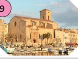
La Ciotat Notre-Dame de Grâce