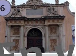
Toulon Ancienne porte de l'arsenal