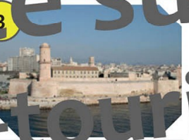
Marseille Fort Saint-Jean