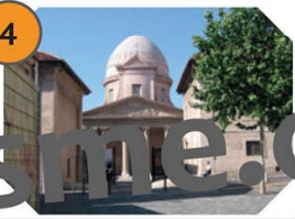
Marseille La vieille Charité