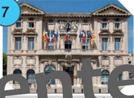
Marseille Hôtel de Ville