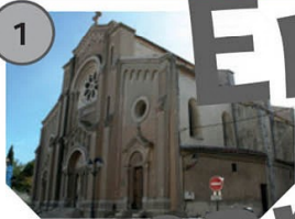
La Seyne-sur-Mer Notre-Dame de Bon Voyage