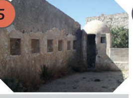
Îles de Hyères Fort de l'Alycastre à Porquerolles