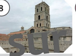
Arles Cloître de Saint-Trophime