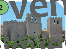
Marseille Basilique Saint-Victor