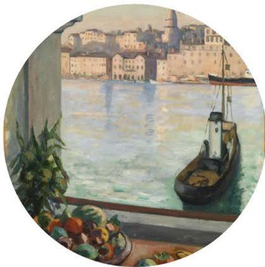
Henri Manguin, Vieux-Port à Marseille, 1925. Huile sur toile