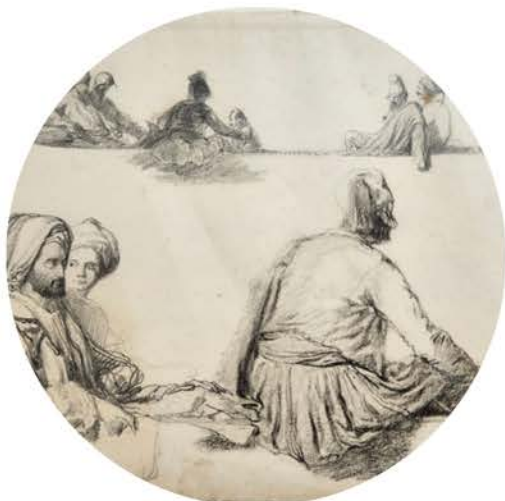
Félix Ziem, Orient, étude de Turcs , 1847. Huile sur papier