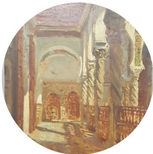
Félix Ziem, Algérie, cour intérieure , 1858. Huile sur papier