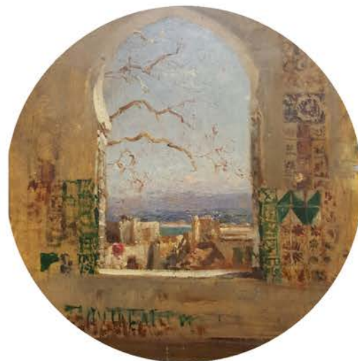
Félix Ziem, Fenêtre orientale, 1858-1860. Huile sur papier