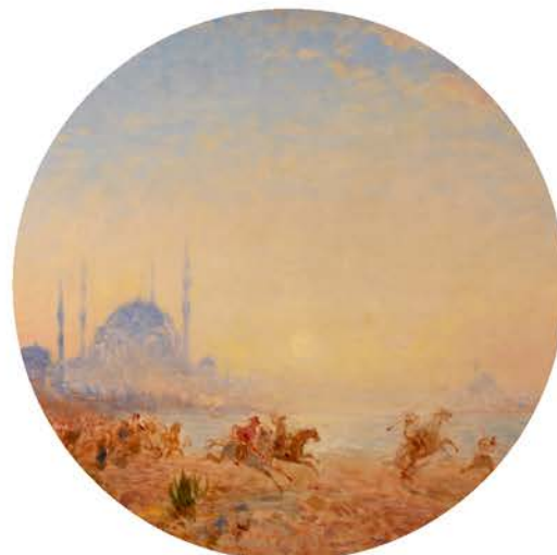
Félix Ziem, Constantinople, Fantasia, 1880-1890. Huile sur toile